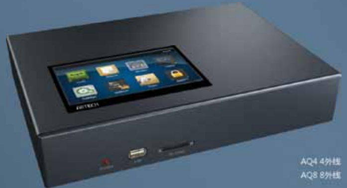
AQ4 4外线 AQ8 8外线